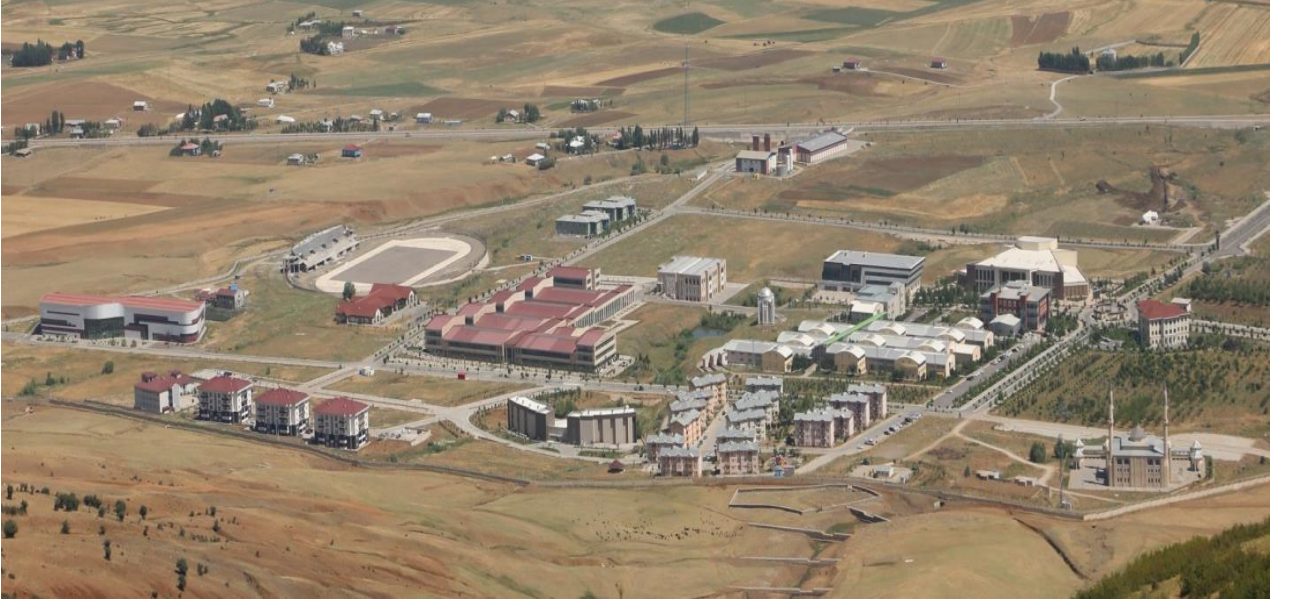
Resim 1 Merkez Külliye Alanı

“Kampüs Altyapısı” projesine baęlı olarak, 2023 yılında ihalesi yapılan “Çevre Düzenleme Yapım İŖi”, “Aęaçlandırma Alanları Damla sulama Yapım İŖi” ve 2023 yılsonu itibariyle % 100 tamamlanmıŖtır.