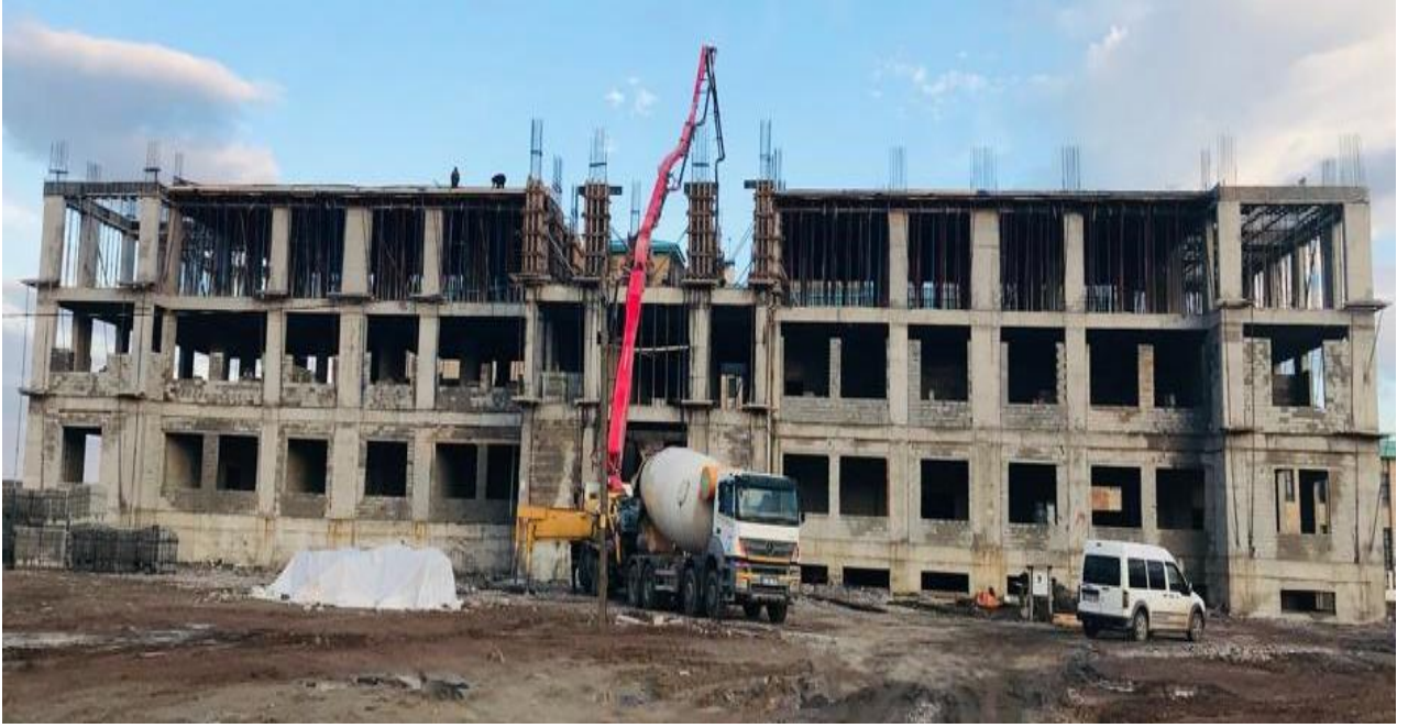
Resim 2 Malazgirt MYO