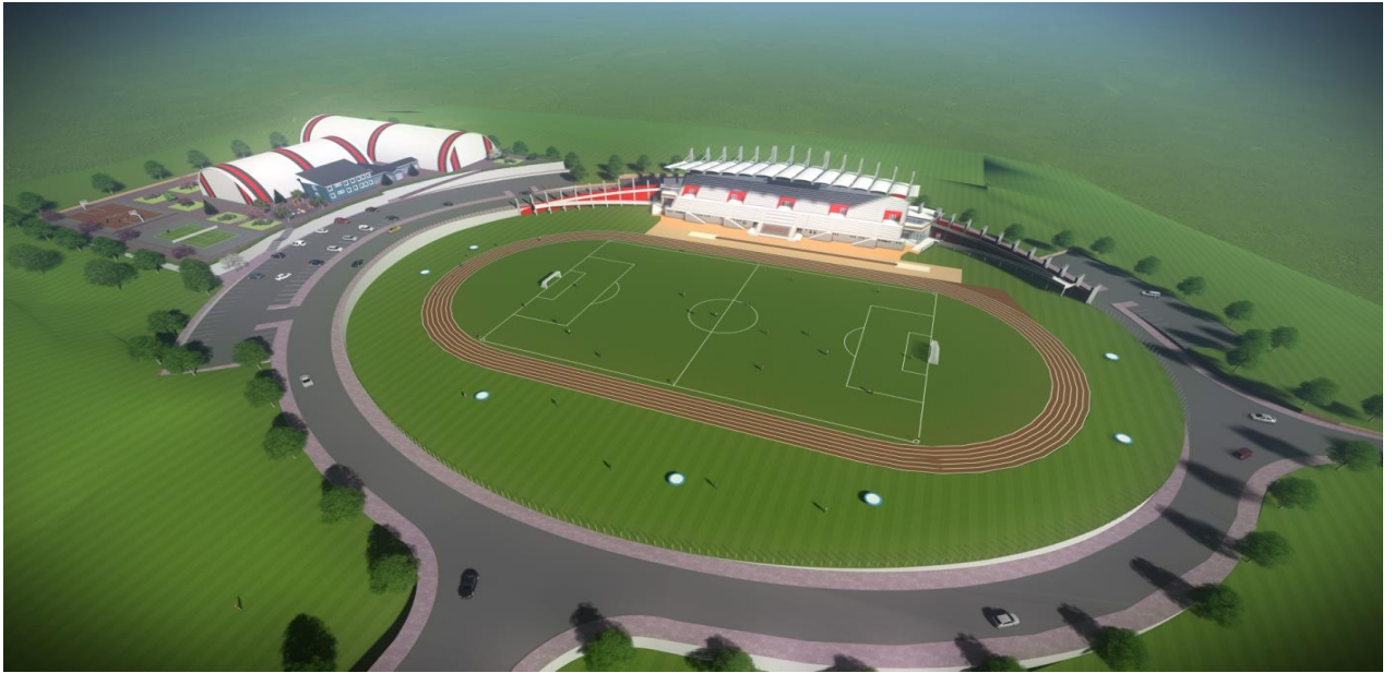
Resim 3 Açık Spor Tesisleri

"Açık ve Kapalı Spor Tesisleri" projesine bağlı olarak; 2020 yılında ihalesi yeniden yapılan 40.777 m 2 kapalı alana sahip "Açık Spor Tesisleri" yapım işinin 2023 yılsonu itibari ile %36'sı tamamlanmıştır. "Açık ve Kapalı Spor Tesisleri" 31.08.2022 tarih ve 60804 sayılı Rektörlük Olur'u ile fesih edilmiştir. Yeni İhale Çalışmaları devam etmektedir.