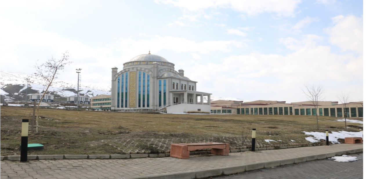
Resim 5 Gazze Camii

Muş Alparslan Üniversitesi Kalkındırma Vakfı tarafından yapımı üstlenilen Gazze Cami'sinin inşaat çalışmaları devam etmektedir.